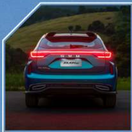
بالى دواوهى وهرزىشى جياواز. گلؤبى دواوه بهستراوتهوه به ديزاينهكهوه