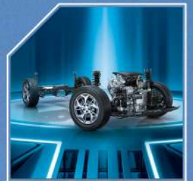
بزوينهري بههيزى تهواو پهروهى پيدراوه پهيوهسته به گيرىكى ئوتوماتيكي 7DCT بههيزى