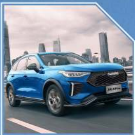
گريلى پيشهوهى به ديزاينىكى سەرنجراكيش دروستكراوه