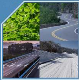
چار شياوزى ليخورين شياوزى ستاندارد و ئابوورى و دوخى وهرزىشى و بهفر.