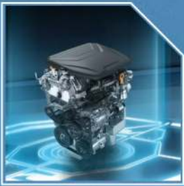
بزوينهري توربو 1500cc هيز و توركى لهگهل كاراىى سەرنجراكيش