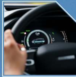
به سيستمى وهستانى ئوتوميلى ئوتوماتيكي لهگهل شاشهى HUD و شهكدردنهوهى وايرليس وپشتگيرى سيستمى ئهپل كارپلهى و ئهندرؤيد ئوتو.