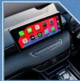
شاشه به روونيهكى زور بهرز قهبارهى 12.3 ئينچ